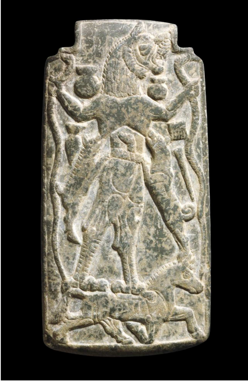
Lamaštu Muskası, Geç Asur Dönemi Amulet, Londra, İngiltere: British Museum/Collection Online.